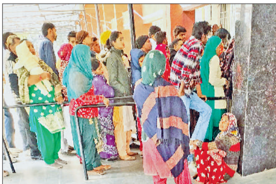
फतेहाबाद। नागरिक अस्पताल में ओपीडी के लिए लगी मरीजों की लाइन।

डायरेक्ट एएमओ भर्ती सहित विभिन्न मांगों पूरी न होने के विरोध में फतेहाबाद जिले के सरकारी अस्पतालों में मंगलवार को डॉक्टर हड़ताल पर रहे। जिले में कुल 97 चिकित्सकों में से 82 चिकित्सक हड़ताल पर रहे। डॉक्टरों की हड़ताल के कारण नागरिक अस्पतालों में पहले ही अपेक्षा काफी कम संख्या में लोग पहुंचे। अधिकतर अस्पतालों व स्वास्थ्य केंद्रों में सन्नाटा पसरा नजर आया। सोमवार की तरह मंगलवार को भी अग्रोहा मेडिकल कॉलेज से बुलाए गए सात डॉक्टरों ने यहां ड्यूटी संभाली। सरकारी डॉक्टर्स की हड़ताल के चलते यहां होने वाले ऑपरेशन की तारीख टल गई है। मरीजों को अब आगे की तारीख दी गई है। सीएमओ का कहना है कि नागरिक अस्पताल में मंगलवार व वीरवार आंखों के ऑपरेशन के