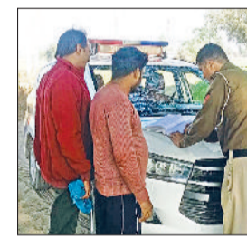
मौके पर कार्रवाई करती पुलिस टीम।