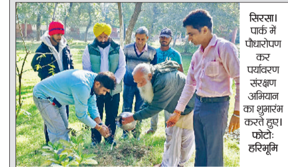
सिरसा। पार्क में पौधारोपण कर पर्यावरण संरक्षण अभियान का शुभारंभ करते हुए।