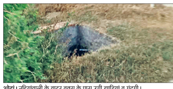
ओढां। नुहियावाली के वाटर वर्क्स के पास उगी झाड़ियां व गंदगी।

हरिभूमि न्यूज ▶▶ ओढां गांव नुहियावाली में वाटर वर्क्स की चारदीवारी व सफाई नहीं होने के कारण हालात ऐसी है कि दूषित पानी पीने से ग्रामीणों को स्वास्थ्य से संबंधित समस्याओं का सामना करना पड़ रहा है। जलघर में जहां पर पीने का पानी स्टोर होता है वहां पर कूड़े के ढेर लगे हुए हैं जिसके कारण जब बरसात होती है तो सारी गंदगी पीने के पानी में चली जाती है। जिस कारण ग्रामीण बीमार हो रहे हैं और गांव में भयंकर बीमारी फैलने