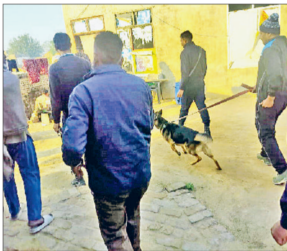
रतिया। शहर में तलाशी अभियान चलाती पुलिस टीम।

अभियान के दौरान पुलिस ने घर-घर जाकर लोगों से पूछताछ की