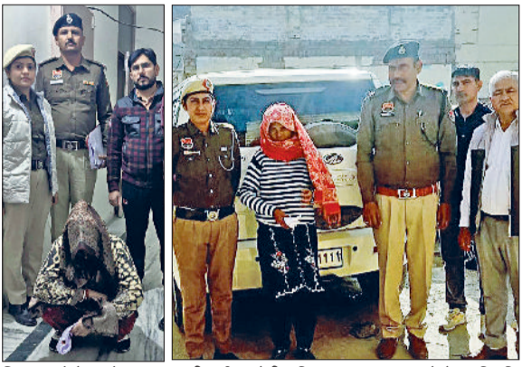
सिरसा। हेरोइन के साथ पकड़ी गई आरोपी महिलाएं।

11 गन हाउस संचालकों और उल्लंघनकर्ताओं को नोटिस जारी किए गए। इस अभियान को और प्रभावी बनाने के लिए फतेहाबाद पुलिस ने अन्य 19 राज्यों के साथ महत्वपूर्ण इंटेलिजेंस साझा किया, जिससे फरार और इंटर-स्टेट अपराधियों की निगरानी और पकड़ को और मजबूत किया गया। पुलिस ने अभियान के दौरान मानवता का संदेश भी दिया और 101 जरूरतमंद और विपत्ति-ग्रस्त लोगों को सहायता प्रदान की। यह कार्रवाई यह सिद्ध करती है कि फतेहाबाद पुलिस ने सिर्फ अपराधियों के खिलाफ बल्कि समाज की बेहतरी के लिए भी प्रतिबद्ध है।