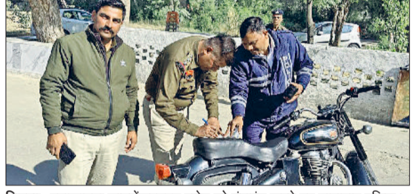
सिरसा। पटाखानुमा साइलेंसरयुक्त बुलेट को इंपाउंड करते हुए यातायात पुलिस।